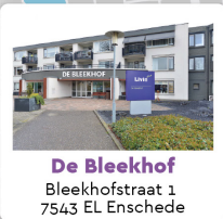
De Bleekhof Bleekhofstraat 1 7543 EL Enschede