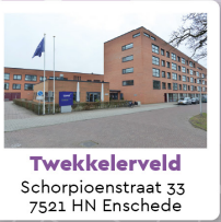
Tweekelveld Schorpioenstraat 33 7521 HN Enschede